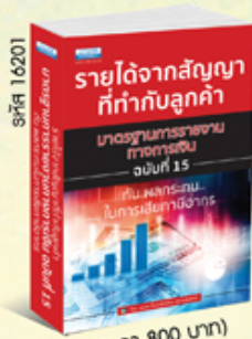
รหัส 16201 (ราคา 800 บาท) สมาชิก 720.- ค่าส่ง 60.-