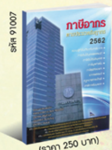
รหัส 91007 (ราคา 250 บาท) สมาชิก 225.- ค่าส่ง 40.-