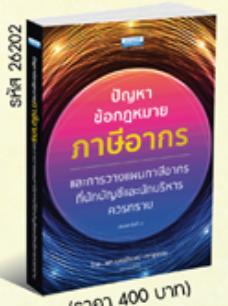
รหัส 26202 (ราคา 400 บาท) สมาชิก 360.- ค่าส่ง 40.-