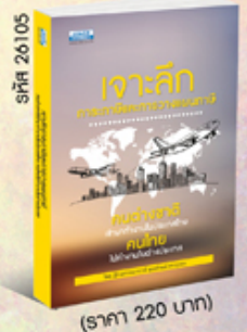
รหัส 26105 (ราคา 220 บาท) สมาชิก 190.- ค่าส่ง 30.-

*สั่งซื้อหนังสือครบ 1,000 บาท (ราคาหนังสือ) จัดส่งแบบลงทะเบียนฟรี