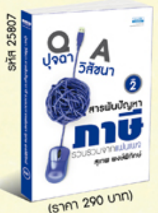
รหัส 25807 (ราคา 290 บาท) สมาชิก 260.- ค่าส่ง 40.-