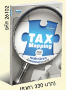
รหัส 26102 (ราคา 330 บาท) สมาชิก 300.- ค่าส่ง 40.-