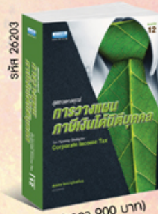
รหัส 26203 (ราคา 900 บาท) สมาชิก 810.- ค่าส่ง 80.-