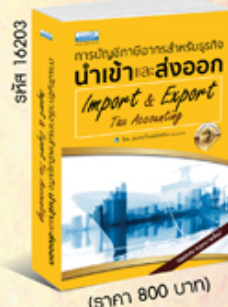
รหัส 16203 (ราคา 800 บาท) สมาชิก 720.- ค่าส่ง 60.-