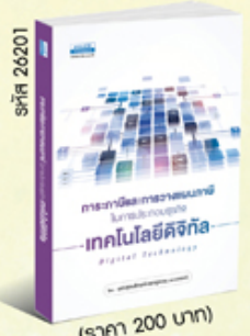
รหัส 26201 (ราคา 200 บาท) สมาชิก 180.- ค่าส่ง 30.-