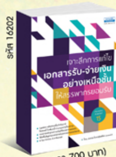
รหัส 16202 (ราคา 700 บาท) สมาชิก 630.- ค่าส่ง 60.-