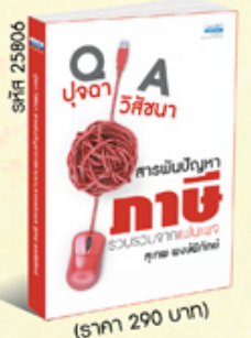
รหัส 25806 (ราคา 290 บาท) สมาชิก 260.- ค่าส่ง 40.-