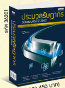
รหัส 36201 (ราคา 450 บาท) สมาชิก 400.- ค่าส่ง 50.-